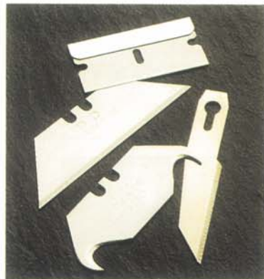
CARBONE ET ACIER INOXYDABLE

LAMES DISPONIBLES DANS UN GRAND CHOIX DE MATERIAUX ET DE FINITIONS