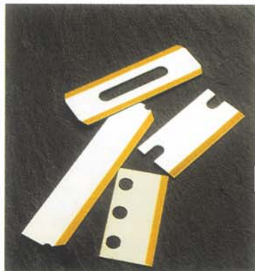
TIN ET AUTRES REVETEMENTS P.V.D. (déposition en phase gazeuse par procédé physique)